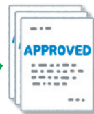
病歴要約 ※10症例の提出

内科専門医取得後 3年以上の内科研修 基幹・連携施設等でのカリキュラム制研修 注)セルフトレーニング問題2回以上受講