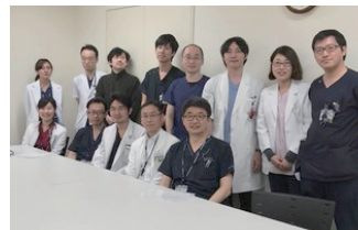
内科系診療センター

経験症例 アカラシアを中心とした食道良性疾患で当院の名前を聞く方も多いと思いますが、ERCP、EUSなどの肝胆膵領域の内視鏡も充実しております。超音波内視鏡下胆道ドレナージなど、大学病院だからこそできる高難易度手技を行う症例に携わることが可能です。