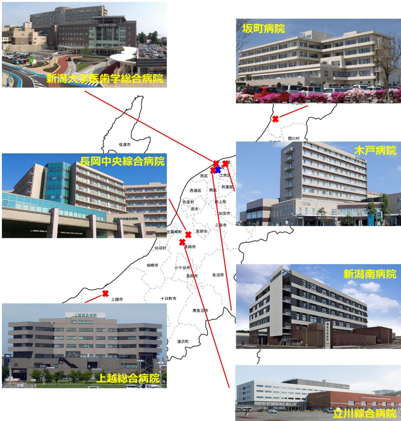
図 2. 各連携施設の位置関係