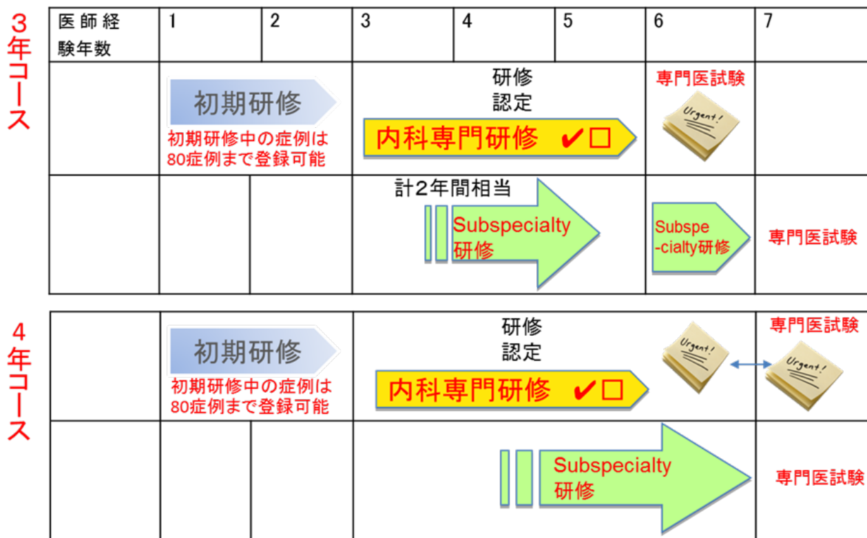
図 1. 内科専門医研修と Subspecialty 研修の並行研修の概念図

4年コースは、前述したように前期2年間は中越医療圏の厚生連長岡中央総合病院、あるいは上越医療圏の厚生連上越総合病院での研修となります（2年目を立川総合病院で研修するパターンもあり）。両施設とも、各医療圏の中核病院として、地域のニーズに応えることのできる、地域完結型の急性期医療を提供する医療機関です。また、両施設ともは住居の斡旋が受けられます。