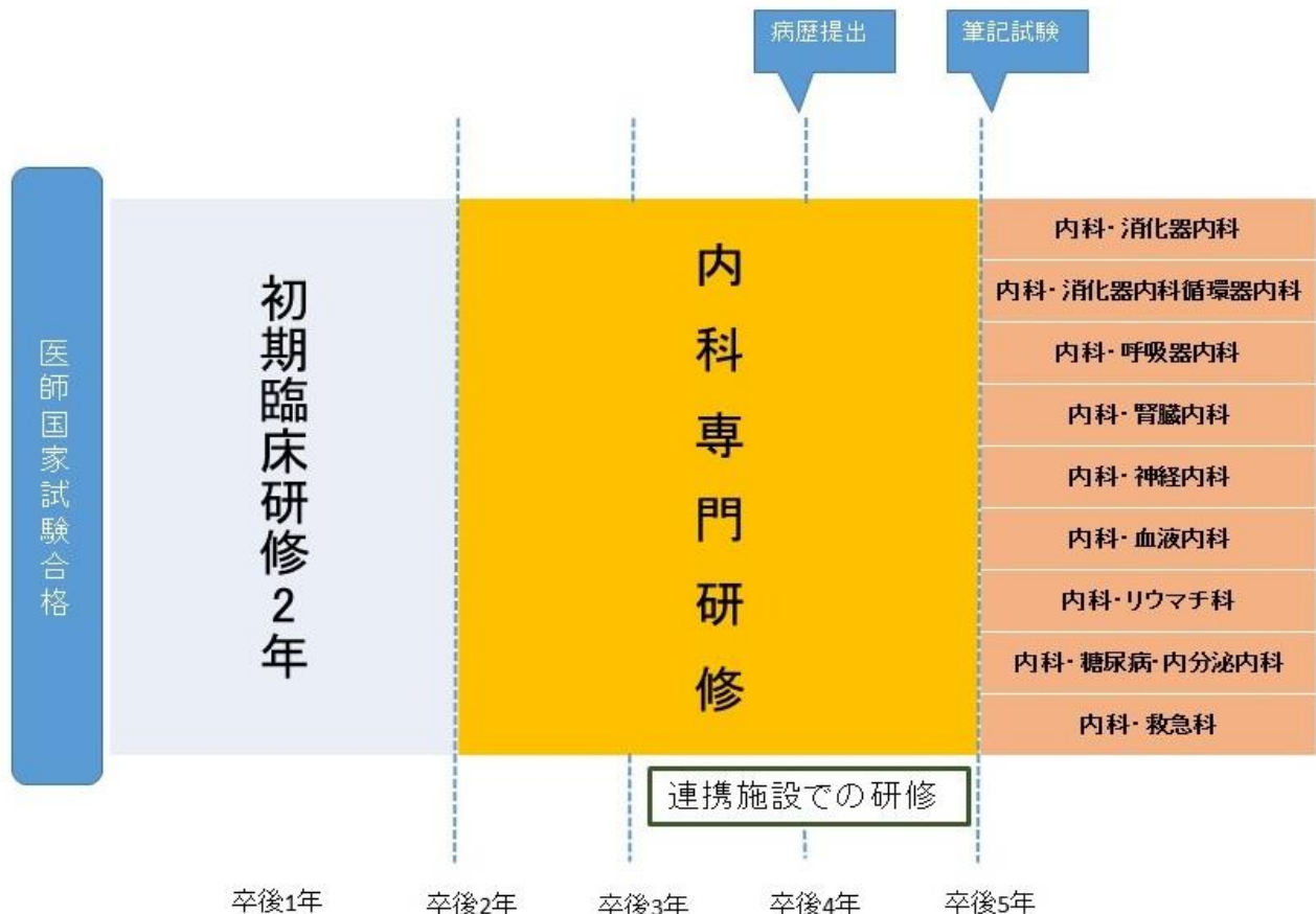
（図1）那覇市立病院内科専門研修プログラム（概念図）

那覇市立病院内科専門研修施設群 研修期間：3年間（基幹施設2年間＋連携・特別連携施設1年間）