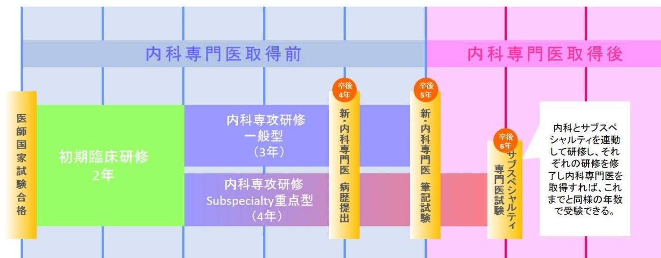
図 1．徳島赤十字病院専門研修プログラム（概念図）